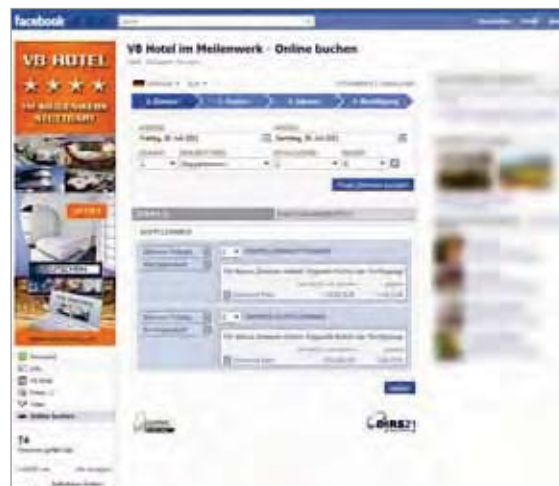
DIRS21 facebook IBE auf der Facebook Fanpage des V8 Hotels im Meilenwerk in Böblingen unter www.facebook.com/v8hotel