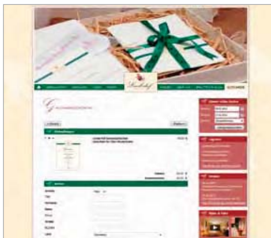
Gutscheinshop auf der Website des Romantik Hotel Linslerhof in Überherrn unter www.linslerhof.de