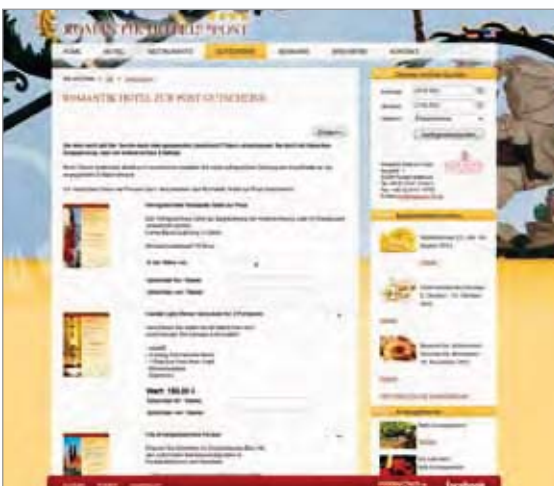
Gutscheinshop auf der Website des Romantik Hotel zur Post in Fürstenfeldbruck unter www.hotelpost-ffb.de