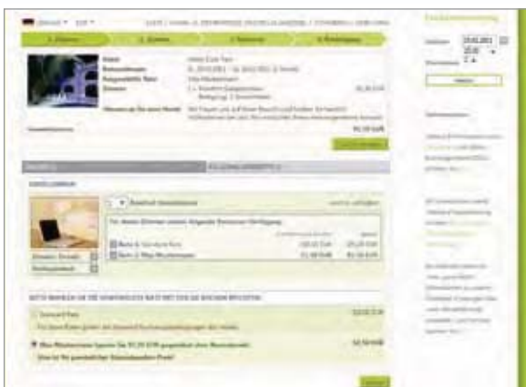
Beispiel für die Verwendung der Stamm- und Firmenpreise im DIRS21 Buchungsmodul