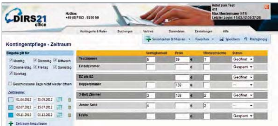
Kontingentpflege – Zeitraum in DIRS21 office zur komfortablen Pflege längerer Zeiträume