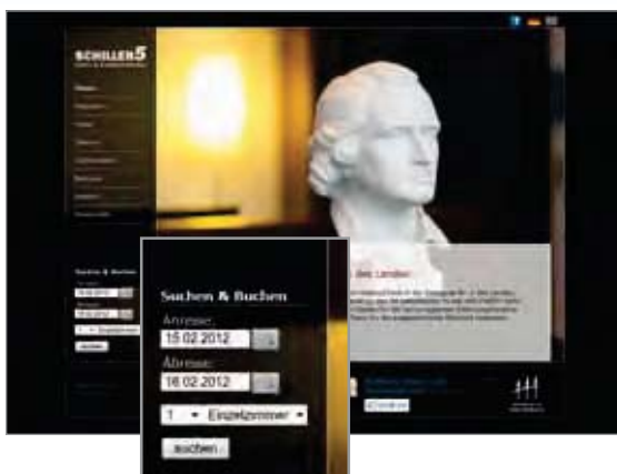
Schnellbuchungsbox auf der Website des Schiller 5 – Hotel & Boardinghouse in München unter www.schiller5.com