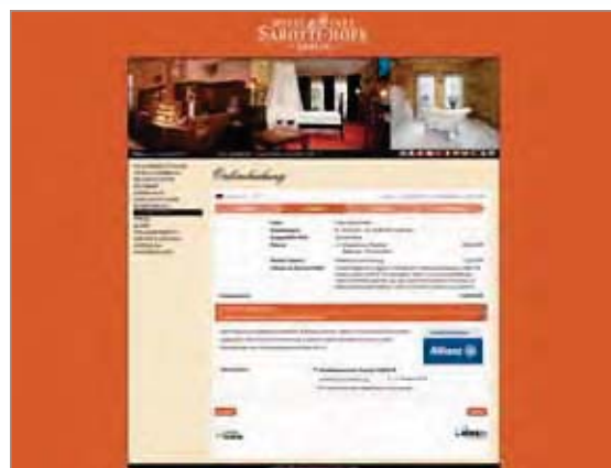
In den Buchungsvorgang integrierte Hotelstornoversicherung der Allianz Global Assistance