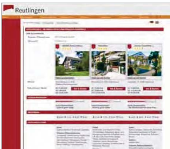
Gruppenbuchungsmodul auf der Website der Stadt Reutlingen