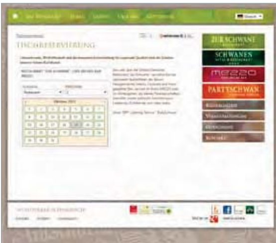
DIRS21 table booker auf der Website des Restaurant Zur Schwane in Metzingen unter www.restaurant-zurschwane-metzingen.de