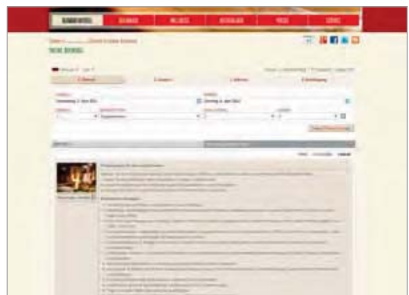
Pauschalbuchungsmodul auf der Website des Wastwirt Romantik Hotel & Spa in St. Michael unter www.wastwirt.at